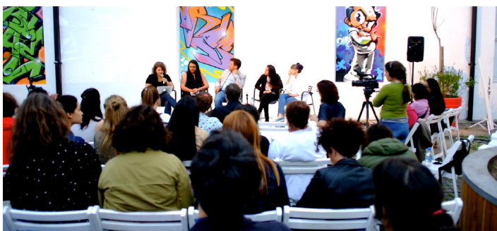
Discusión en el Centro Cultural Recoleta

sentido que tenemos en común a todos los delitos que estamos viendo aquí. Es borrar esa identidad, porque una vez borrado entonces ya no causamos ninguna controversia, no tenemos ninguna necesidad de manifestar. Estamos también escuchando la problemática de la situación de calle, nos estamos olvidando de retomar la muerte, estamos ante una muerte social, no la estamos considerando, de ahí que nosotros como equipo nos preocupamos mucho por retomar este sentido desde las ciencias forenses y desde la propia antropología, desde la propia historia y desde quienes queremos también crear nuestra memoria con respecto a los problemas sociales. No podemos perder de vista que hay que recuperar esta identidad de las personas que son borradas sistemáticamente desde hace muchas décadas.