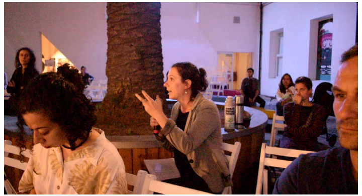
Discusión en el Centro Cultural Recoleta

CC: A lo largo del tiempo y sobre todo en los últimos años en los familiares ha ido cambiando el tono de esas nociones de justicia, justamente por los marcos de impunidad. Nosotros salimos hace muy poco de un juicio, que es de los más grandes juicios del Operativo Independencia, con varios absueltos. Y eso genera en los familiares un cambio en su noción de justicia.