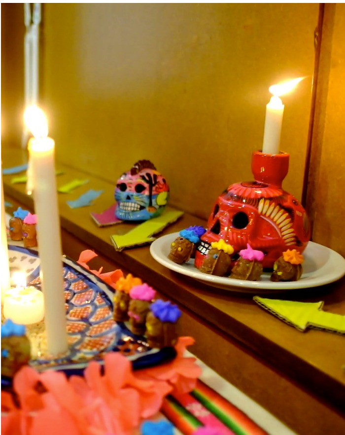
Mesa de Muertos con Mate

Como suelo decir cuando hablamos de genética, el ADN no es un código de barras . Es un asunto probabilístico y desde la perspectiva del EMAF, creemos que aquellos datos estadísticos que van a entrar en juego deben contar con parámetros que vienen de la investigación, que nos permita atraer universos más limitados al ejercicio de confronta, de manera que salgan identificaciones positivas. Otro tema importante es el punto de bioética y quién está en poder de esta información. En un artículo reciente de Margarita Guillén ( http://www.publicacions.ub.edu/refs/indices/08025.pdf ) una magistrada española. Ella reflexiona en torno a las primeras denominaciones de los perfiles genéticos, los finger printing DNA , creando una falsa percepción de los perfiles genéti-