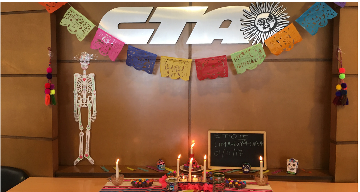
Altar de Muertos en CTA

Además, nosotros en el trabajo en El Atlético hemos descubierto la alianza entre la arqueología y las artes y las expresiones artísticas. Muchas veces el arte es algo que no se menciona o que no se valora en este contexto y me parece que es una herramienta que puede ayudar mucho a la Antropología Forense.