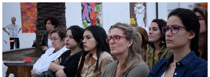
Discusión en el Centro Cultural Recoleta

RE: En igual sentido, cabe la pregunta por ¿cómo concebimos el trabajo forense con restos humanos?, ya que al final de cuentas son personas. Las nuevas formas de los crímenes nos dejan en una metodología muy corta de la Antropología Forense en materia de identificación: son muchas veces restos más pequeños, fragmentos de huesos calcinados, pequeños indicios que a nivel biológico son muy difíciles de identificar, pero en donde también perdemos la perspectiva de que se trata de personas. No podemos llegar a un familiar a decirle que aquella muestra que se levantó es un pequeño fragmento óseo calcinado que al final de cuentas se consumió, en una prueba de genética, y que se trataba de su familiar. Y que la restitución no será de los restos sino de un papel donde hay una serie de gráficos y de datos numéricos. No ceder esta capitalización de los cuerpos, sea desde el crimen organizado o sea desde el Estado. Eso sucede mucho con nuestros colegas forenses, no principalmente antropólogos, pero sí de toda esta tendencia forense que se están desarrollando, en qué momento vamos a devolver esta calidad de personas a los restos que analizamos ¿son restos, son individuos, llegan a ser colecciones osteológicas y estamos hablando de personas que perdieron la vida en las peores circunstancias?