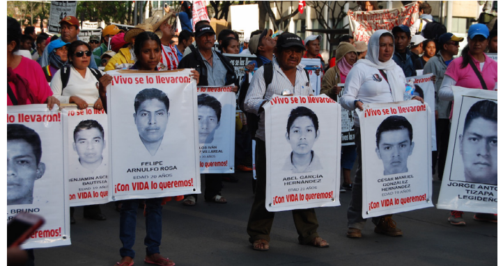
Marcha por los Desaparecidos de Ayotzinapa

cohecho, por lo que el reto de los activistas de Derechos Humanos que trabajan directamente con la documentación de los casos y el análisis de evidencias, es incorporar una lectura politizada a sus quehaceres, para generar que sea atendida la demanda por mejores métodos y procedimientos en el peritaje de evidencias.