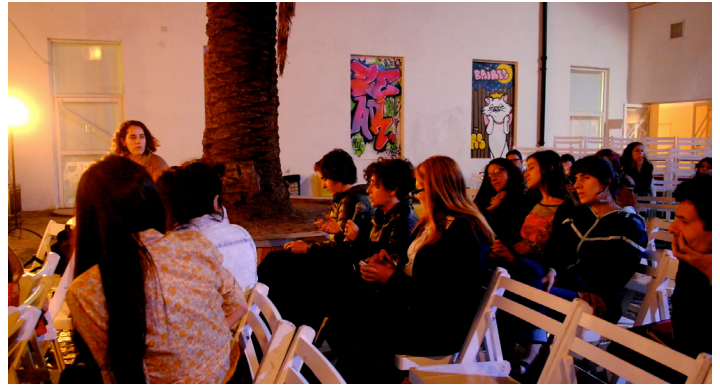
Discusión en el Centro Cultural Recoleta