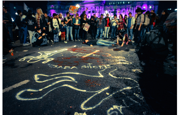
Enfrente de Casa Rosada

autor material de la persona que disparó sino que estamos hablando de una cadena de responsabilidades que llevó a que ese tipo puede impunemente disparar, matar y dejar un cuerpo, o enterrar un cuerpo en algún lugar. Entonces quizá tenemos que apuntar a otras responsabilidades más allá del autor material.