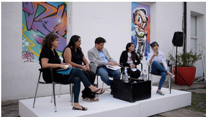
Discusión en el Centro Cultural Recoleta

AH: Lo que habría que entender es esa particular división de trabajo y también el hecho que los familiares en distintos estados de la República empezaron a localizar realmente zonas y sitios que las autoridades no tenían registrados. No era un capricho y no se trataba de desplazar a la autoridad porque en realidad nadie estaba buscando. Eso ocurría tanto en la zona Guerrero, y luego en estados como Veracruz o Coahuila, donde estamos dando un seguimiento a estos procesos. La división del trabajo consiste en que la familia localiza, y solamente si se tiene confirmado el hallazgo, la Policía Científica entra. Es decir, hay que entender que la Policía Científica en esos lugares no busca y que los familiares hacen una labor que nadie más haría.